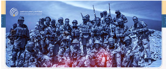
تقرير «جيوش الظل (2)»

قام المركز بتنظيم وإقامة حدث جانبي لإطلاق النسخة الثانية من تقرير «جيوش الظل» الذي يتناول موضوع استخدام المرتزقة، حيث قدم المتحدثون في الحدث الجانبي تحليلاً متعمقاً للمجموعات المقاتلة الأجنبية في سوريا التي تنطبق عليها تعريف القوات المرتزقة، وتناول الشركات الأمنية والعسكرية الخاصة وطبيعة دورها في النزاعات المسلحة والنزاع السوري تحديداً وفي إطالة أمد الحرب وتعطيل فرص التسوية وإنهاء النزاع.