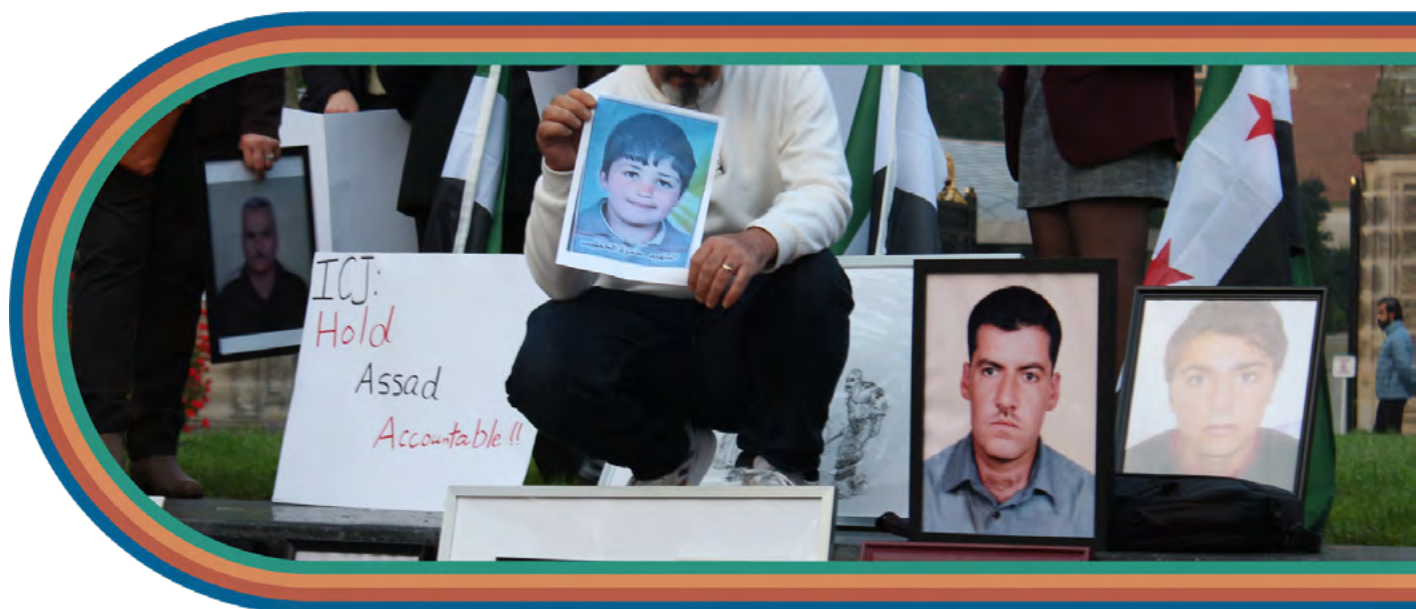
Holanda, Den Haag, Xwepêşandana Pêşîn a ICJ 10 Cotmeh 2023

Sala 2023an bû şahidê çend destkeftiyên li ser asta mafên mirovan û navdewletî, ku di encama hewildanên alîgiriyê de bi serkêşîya rêxistinên civaka sivîl û komeleyên qurbanîyan di salên borî de pêk hatin, ku ya herî girîng ji wan bû: