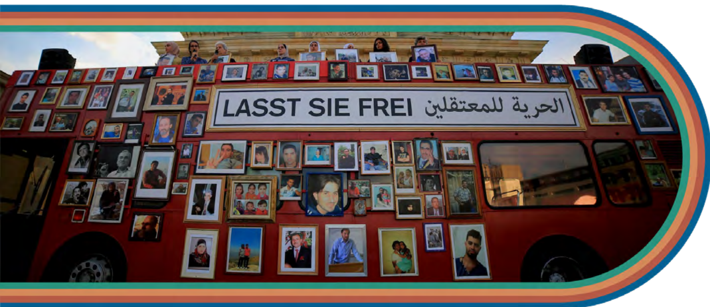
Otobusa Azadiyê wêneyên girtiyan hilgirtiye Berlîn - Almanya Adar 2023