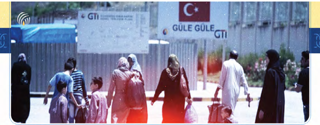
حدث جاني على هامش الدورة 54 لمجلس حقوق الإنسان حول: